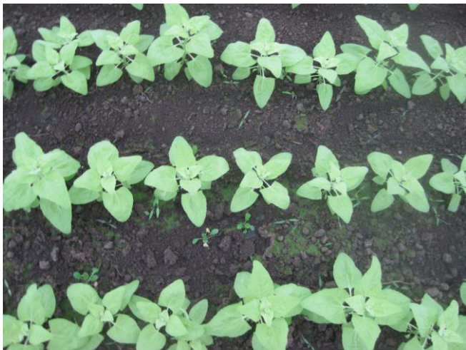
Abb. 8: 'Mondseer' (Reinsaat)