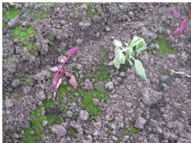
Abb. 11: Kulturschäden durch Kälte nach 1. Schnitt