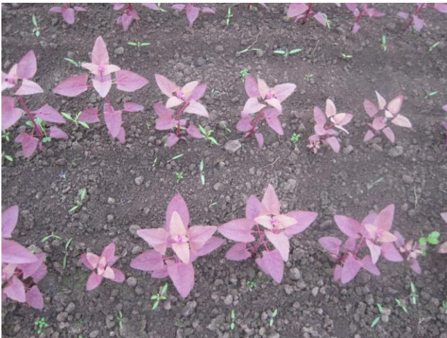
Abb. 4: 'Rote Melde' (Reinsaat)