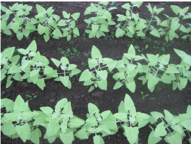
Abb. 2: 'Gelbe Melde' (Bingenheim)