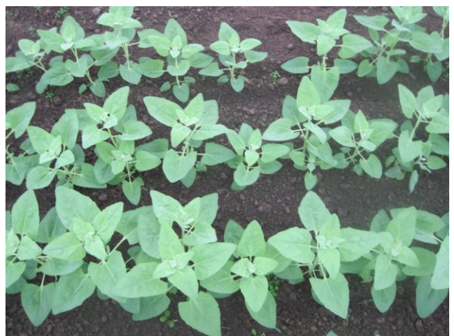
Abb. 7: 'Grüne Melde' (Sativa Rheinau)