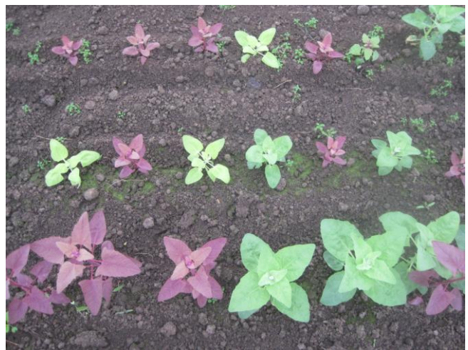
Abb. 9: 'Tricolor' (Reinsaat)