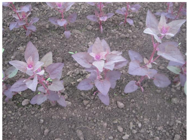
Abb. 5: 'Melde Violett' (Rühlemann's)