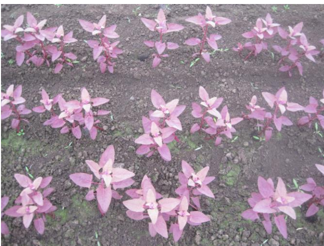
Abb. 6: 'Rubra' (Rühlemann's)