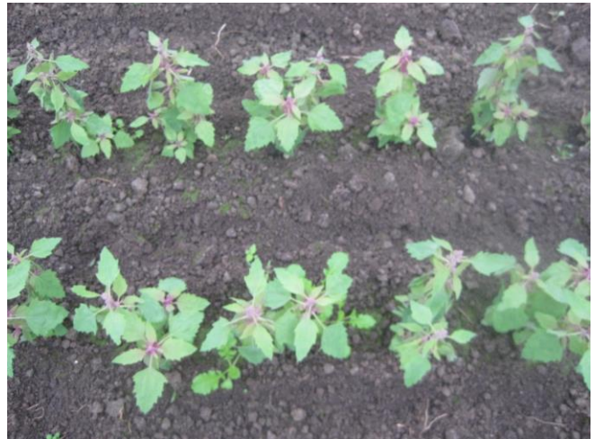
Abb. 3: 'Magentaspreen' (Dreschflegel)