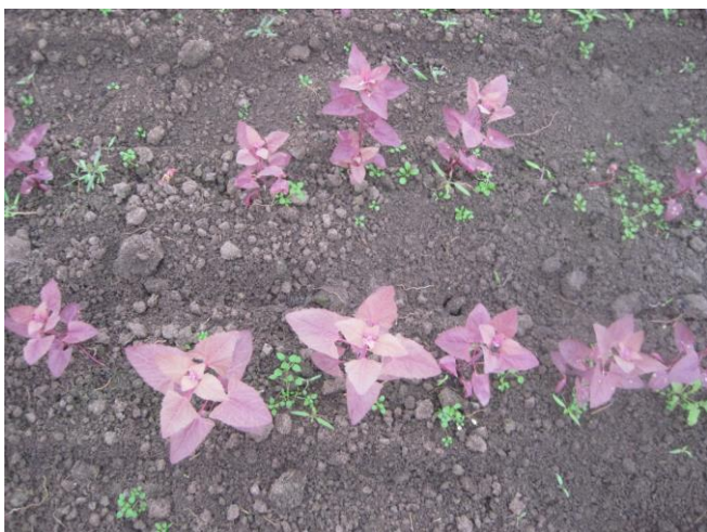
Abb. 10: 'Rote Melde' (Sativa Rheinau)